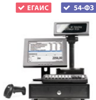
АТОЛ Супермаркет ЕГАИС