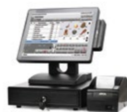
АТОЛ Ресторан ЕГАИС 15"