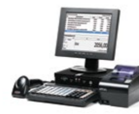
АТОЛ Ритейл ЕГАИС Pro