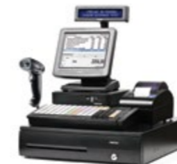
ForPOST Супермаркет ЕГАИС 8"