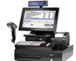
ForPOST Retail Профи ЕГАИС