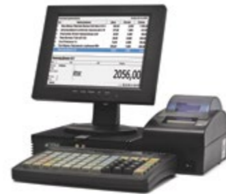
АТОЛ Ритейл 54-Pro