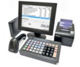
АТОЛ Ритейл ЕГАИС Pro Smart