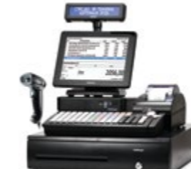
ForPOST Супермаркет ЕГАИС 10"