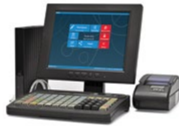
АТОЛ Ритейл 54-Smart