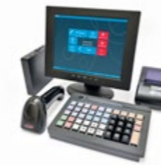
АТОЛ Ритейл ЕГАИС Lite Smart