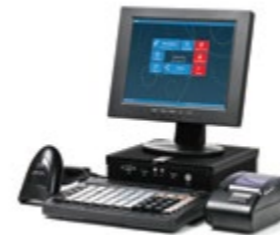
АТОЛ Ритейл ЕГАИС Lite